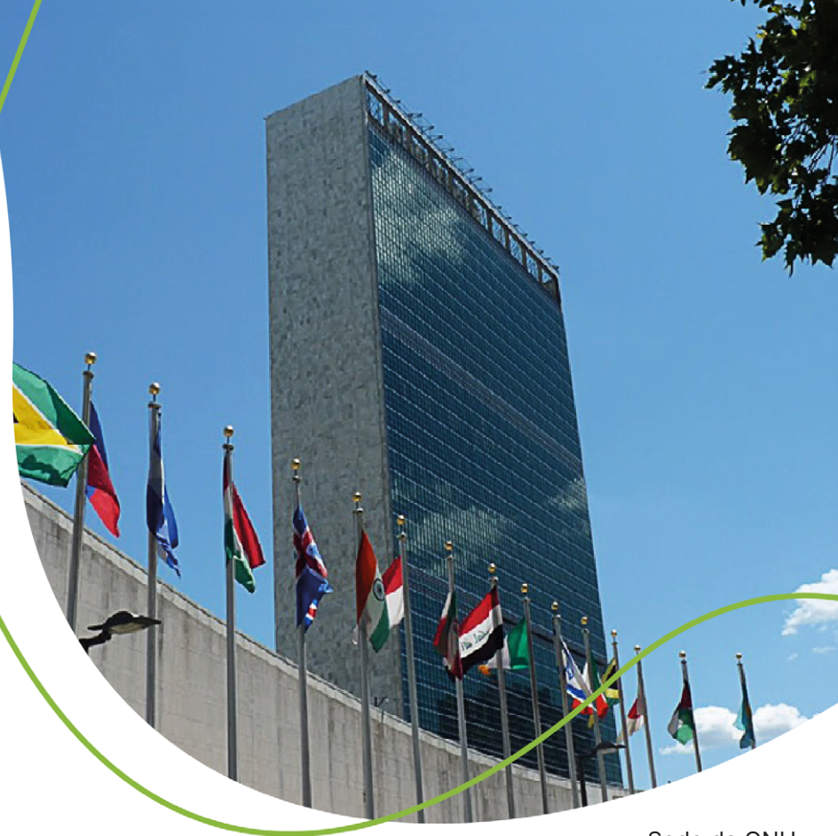
Sede da ONU

Até 2030, esses objetivos devem ser implementados por todos os países do mundo, e as cooperativas, por meio do trabalho voluntário, também estão convidadas a apoiar essa corrente. Com isso, o Dia de Cooperar segue uma tendência mundial de agir em consonância com o desenvolvimento sustentável.