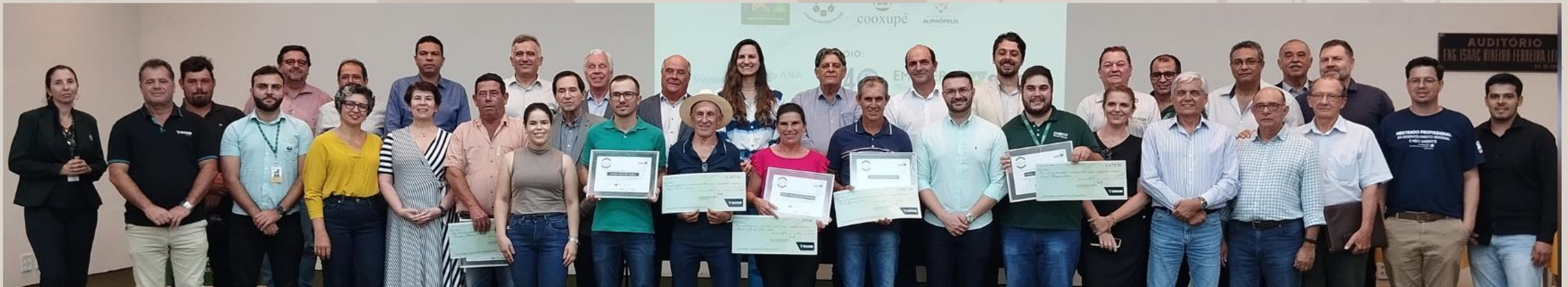
MOMENTO DA ENTREGA DOS CERTIFICADOS E DO PAGAMENTO POR SERVIÇOS AMBIENTAIS (PSA) AOS PRODUTORES

O Conselho Nacional do Café, com uma visão voltada para a proteção dos mananciais e matas ciliares, lançou em 2021, o Programa Café Produtor de Água, em convênio com as associações e cooperativas vinculadas à entidade, além dos parceiros: OCB - Sescoop, Mapa, ANA, IICA, EMATER-MG e Prefeituras Municipais. O projeto piloto está sendo realizado pela Cooxupé em parceria com a prefeitura de Alpinópolis (MG). Parte da estratégia de implementação prevê premiar os produtores rurais de café, por serviços ambientais prestados , que se comprometem e executam o conjunto de ações preconizadas pelo Programa. O projeto iniciou sua expansão também em nossa associada Monteccer, na cidade de Monte Carmelo, em parceria com a Prefeitura Municipal e outros parceiros. Mais recentemente, o programa está sendo expandido para a região atendida pela Minasul, em parceria com a Sicoob Credivar.